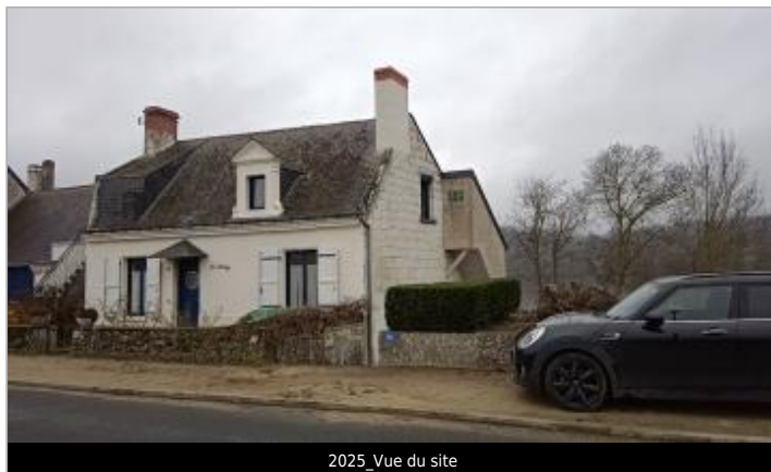
2025_Vue du site