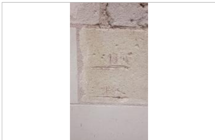
2025_Vue du repère