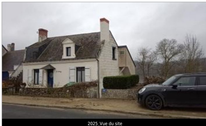
2025_Vue du site

Coordonnées WGS84 : X: -0.19918664 / Y: 47.33720360