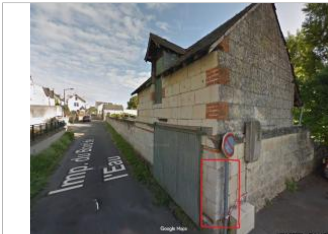
Vue du site 1 (2013 - Maps)