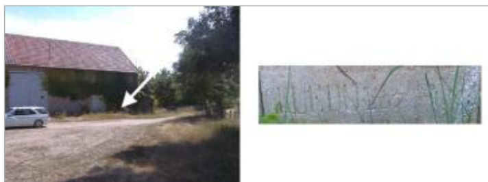
Vue du repère en 2003