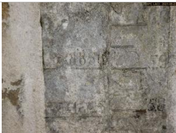
Vue du repère (marque du haut)

Altitude calculée de l'eau (en m) : 228.61 m