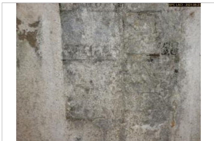
Le repère se situait en dessous de celui de 1852 à 20 cm (disparu)

Altitude calculée de l'eau (en m) : 228.31 m