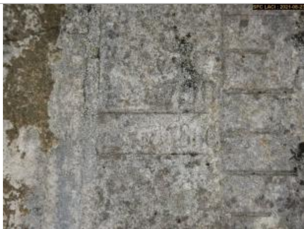
Vue du repère (Marque du haut)

Altitude calculée de l'eau (en m) : 229.21 m