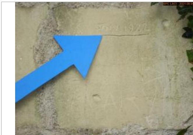
Vue du repère rapprochée en 2021

Différence entre le niveau d'eau et la référence (en m) : 1.800 m