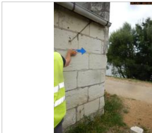
Vue du repère en 2021

Différence entre le niveau d'eau et la référence (en m) : 1.660 m