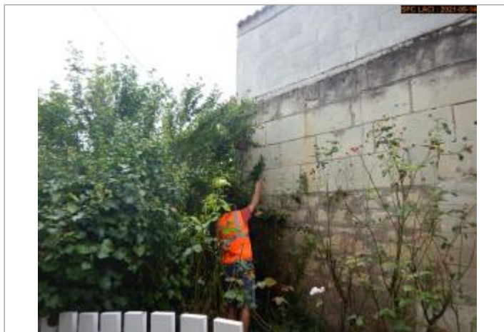
Vue du site du repère de la crue de juin 1856 en 2021