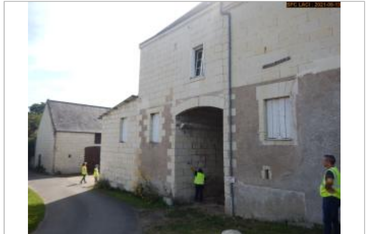
Vue du site en 2021