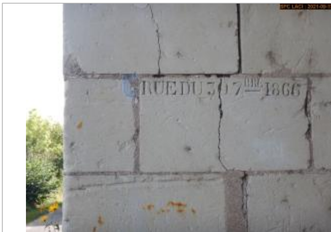
Vue du repère rapprochée en 2021

Altitude calculée de l'eau (en m) : 39.374 m