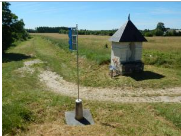
Vue du site en 2016