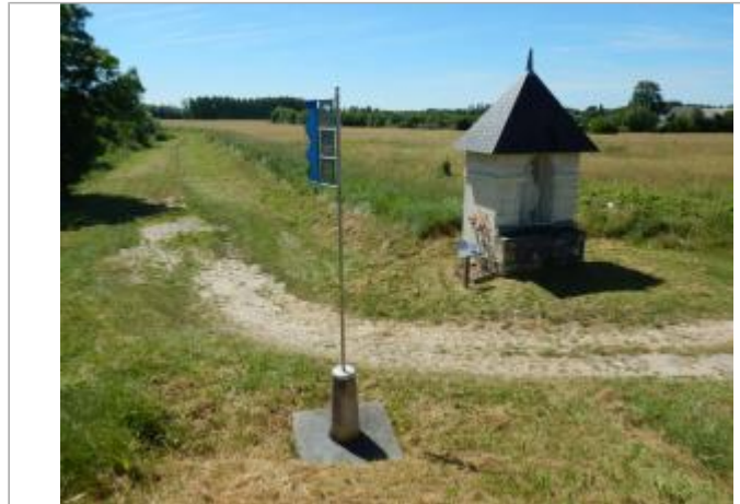
Vue du site en 2016