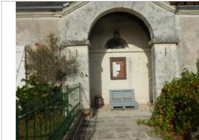
Vue du site en 2023 (Porche)