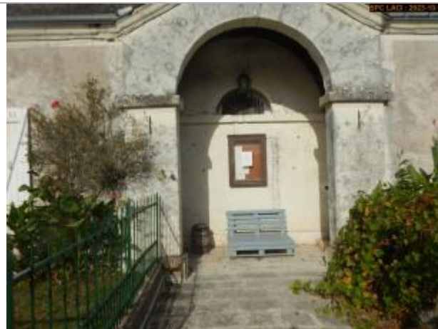
Vue du site en 2023 (Porche)