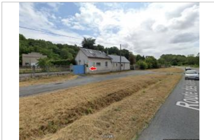
Vue du site en 2019