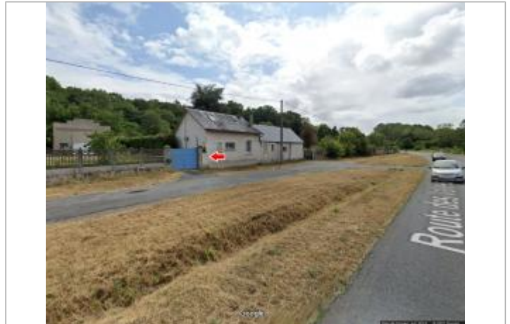
Vue du site en 2019