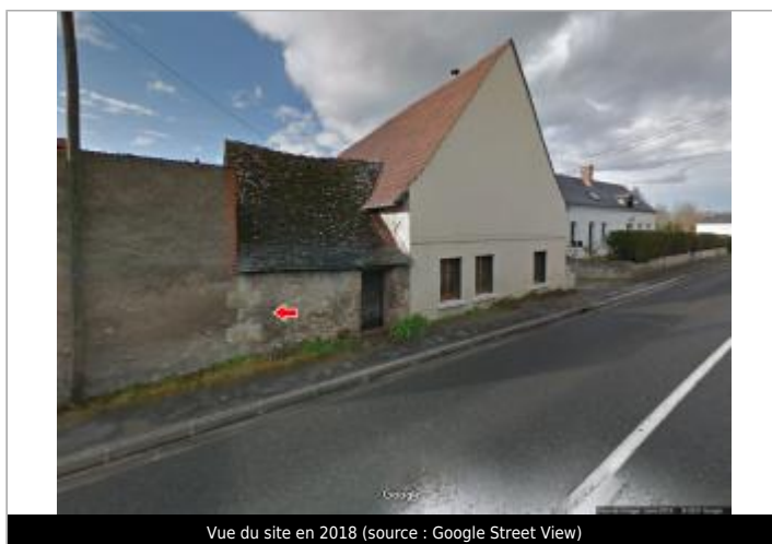
Vue du site en 2018