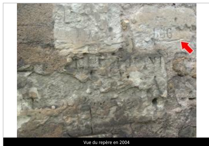
Vue du repère en 2004