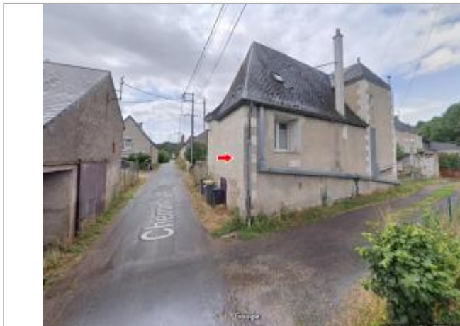
Vue du site en 2019