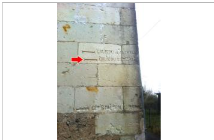
Vue du repère en 2013