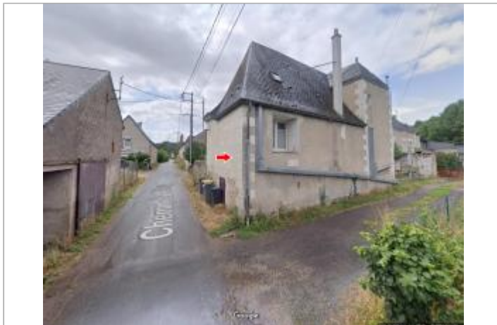
Vue du site en 2019