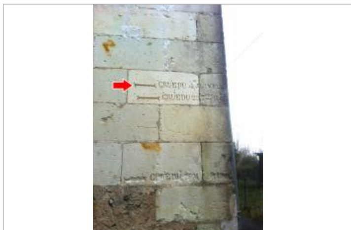
Vue du repère en 2013