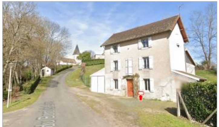
Vue du site en 2023, avec le repère de 1866

Coordonnées WGS84 : X: 3.74440890 / Y: 46.56656300