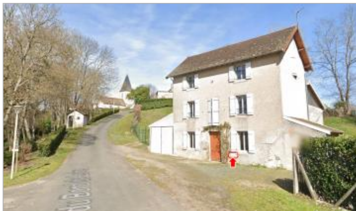
Vue du site en 2023, avec le repère de 1866