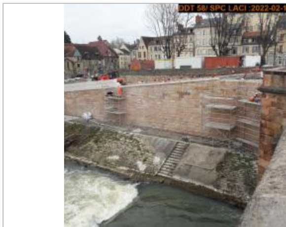
Vue du site en 2022