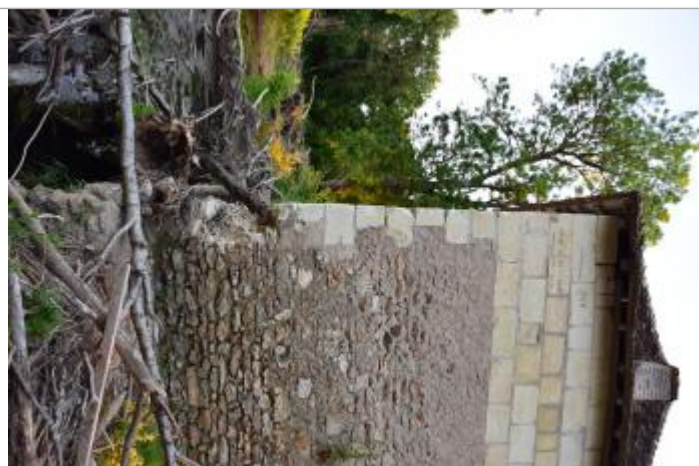
Moulin face Nord

Système altimétrique : NGF IGN 1969 (système normal)