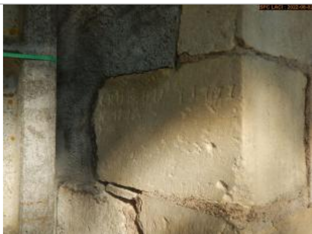
Vue du repère éloignée

Altitude calculée de l'eau (en m) : 161.281 m