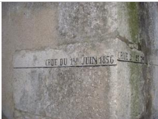
Vue du repère en 2000 (recensement d'origine)

Altitude calculée de l'eau (en m) : 131.28 m