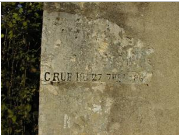
Photo d'un des deux repères de la crue du 17/09/1866, prise en 2000 (recensement d'origine)

Altitude calculée de l'eau (en m) : 131.3 m