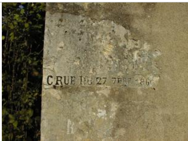
Photo d'un des deux repères de la crue du 17/09/1866, prise en 2000 (recensement d'origine)

Altitude calculée de l'eau (en m) : 131.3 m