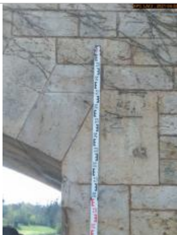
Vue du repère en 2021 côté Loire aval