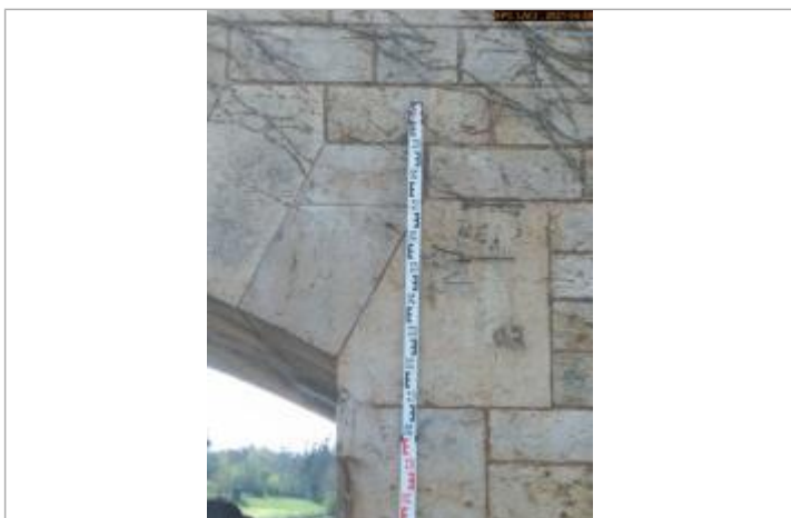
Vue du repère en 2021 côté Loire aval