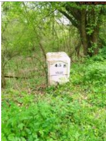
Vue du repère en 2021