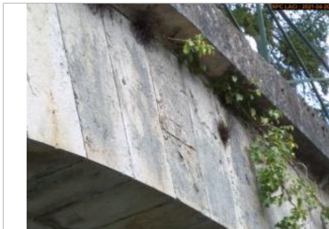
Vue du repère en 2021 milieu pont côté aval

Altitude calculée de l'eau (en m) : 135.98 m