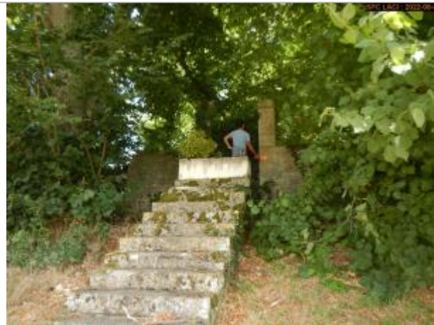
Vue du site (côté droit de la porte)