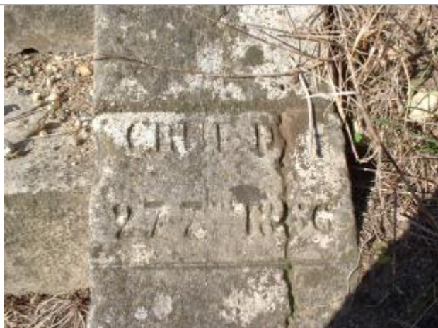
Vue du repère rapprochée en 2001

Altitude calculée de l'eau (en m) : 173.884 m