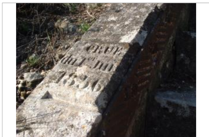
Vue du repère en 2001

Code : LCI_R_78_1311 Date de mise à jour : 09/02/2022 Auteur : SPC LCI