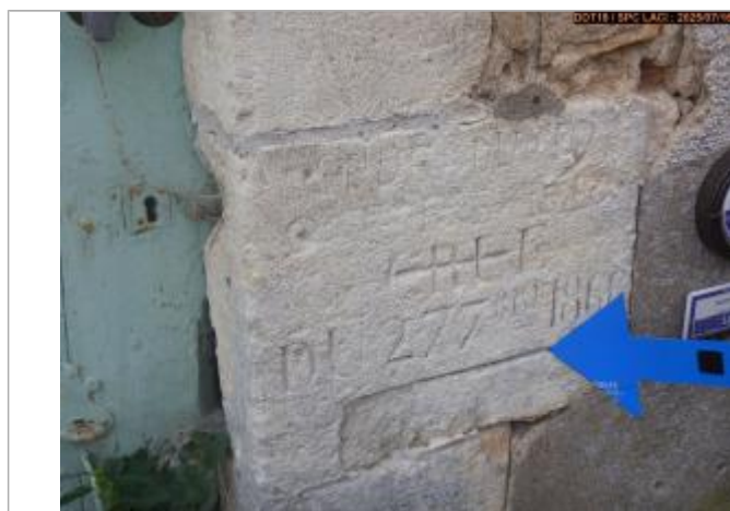
Vue du repère gravé

Altitude calculée de l'eau (en m) : 162.332 m