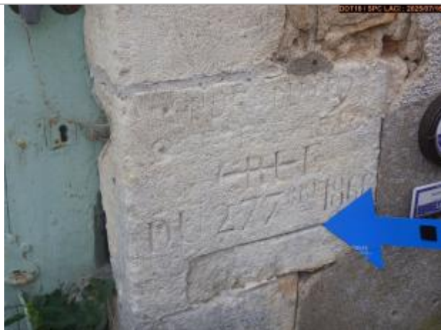
Vue du repère gravé

Altitude calculée de l'eau (en m) : 162.332 m