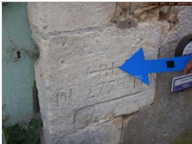
Vue du repère gravé (coté montant)

Altitude calculée de l'eau (en m) : 162.437 m