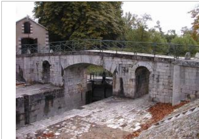
Vue du site en 2001