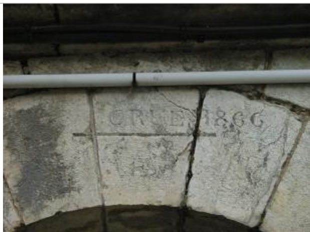
Vue du repère en 2001

Altitude calculée de l'eau (en m) : 135.335 m