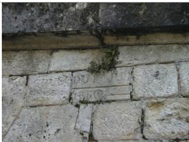
Vue du repère en 2001

Altitude calculée de l'eau (en m) : 135.285 m