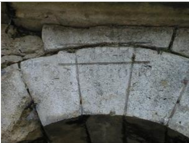
Vue du repère en 2001, avec celui du 20 octobre 1856

Altitude calculée de l'eau (en m) : 135.235 m