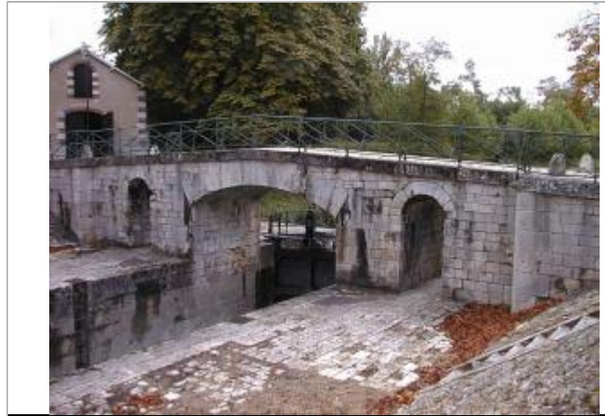
Vue du site en 2001