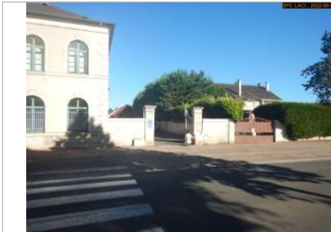
Vue du site éloignée en 2022

Coordonnées WGS84 : X: 2.92728726 / Y: 47.41744530