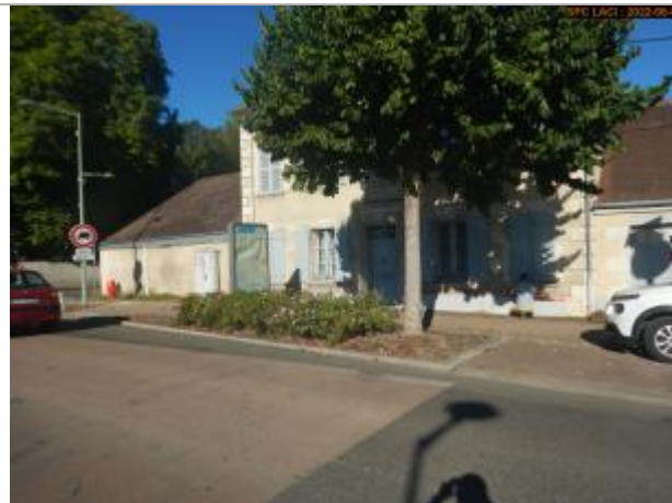
Vue du site éloignée en 2022