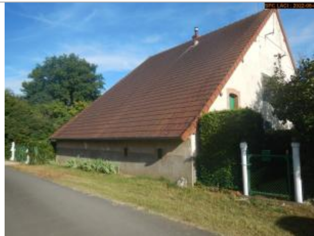
Vue du site éloignée en 2022