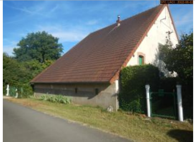
Vue du site éloignée en 2022

Coordonnées WGS84 : X: 2.91261580 / Y: 47.43133190