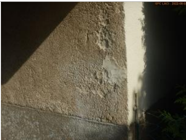
Vue du repère en 2022

Altitude calculée de l'eau (en m) : 144.02 m