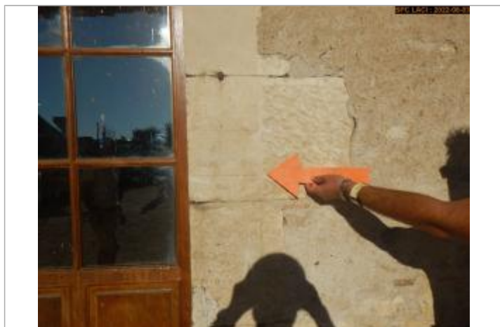
Vue du repère éloignée (montant droit)

Altitude calculée de l'eau (en m) : 142.75 m