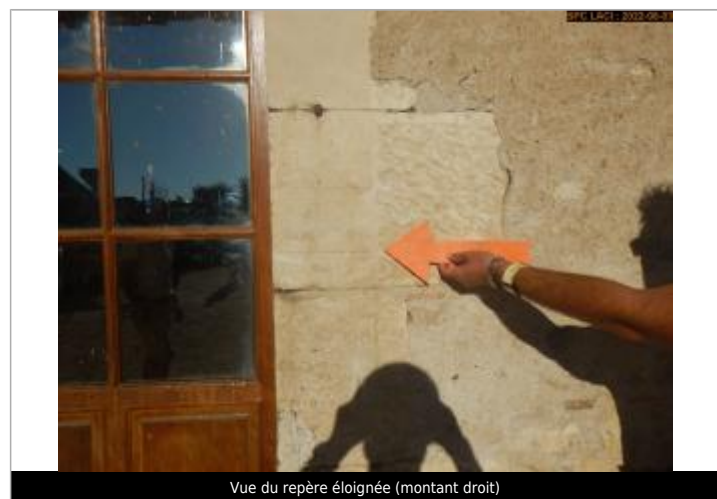
Vue du repère éloignée (montant droit)

GÉNÉRAL Code : LCI_R_634_1261 Date de mise à jour : 13/01/2023 Auteur : SPC LCI