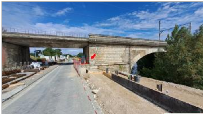
Photo du site pendant les travaux de la digue, en juillet 2023