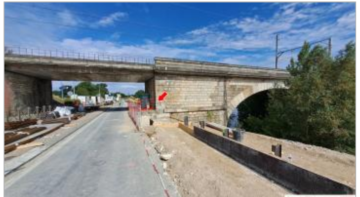
Photo du site pendant les travaux de la digue, en juillet 2023