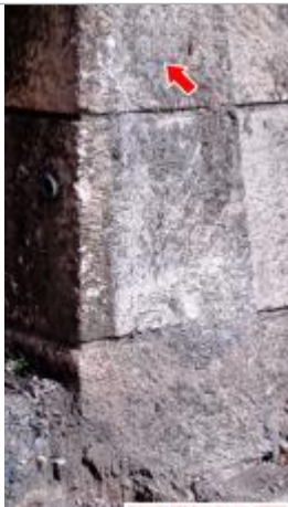
Vue du repère pendant les travaux de la digue en juillet 2023