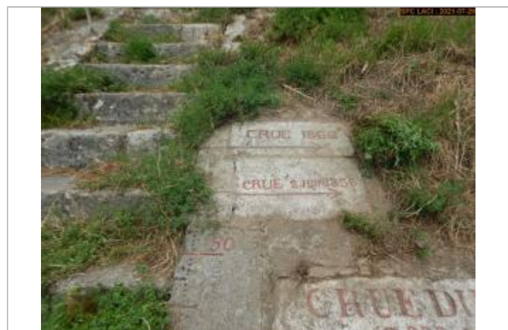
Vue du repère rapprochée en 2021 escalier côté pont

GÉNÉRAL Code : LCI_R_619_1225 Date de mise à jour : 11/02/2022 Auteur : SPC LCI