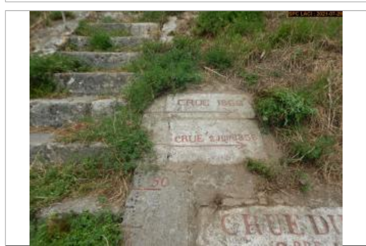
Vue du repère rapprochée en 2021 escalier côté pont

GÉNÉRAL Code : LCI_R_619_1224 Date de mise à jour : 11/02/2022 Auteur : SPC LCI