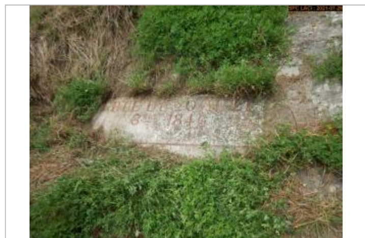
Vue du repère rapprochée en 2021 escalier côté rampe