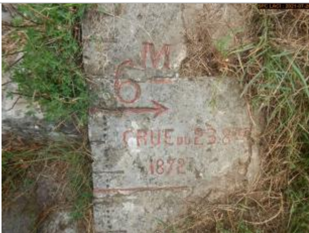
Vue du repère rapprochée en 2021 escalier côté pont

Altitude calculée de l'eau (en m) : 104.81 m