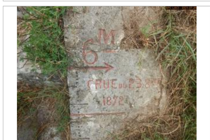
Vue du repère rapprochée en 2021 escalier côté pont

GÉNÉRAL Code : LCI_R_619_1222 Date de mise à jour : 11/02/2022 Auteur : SPC LCI