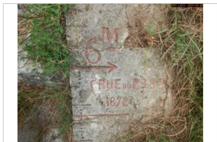
Vue du repère rapprochée en 2021 escalier côté pont

GÉNÉRAL Code : LCI_R_619_1222 Date de mise à jour : 11/02/2022 Auteur : SPC LCI