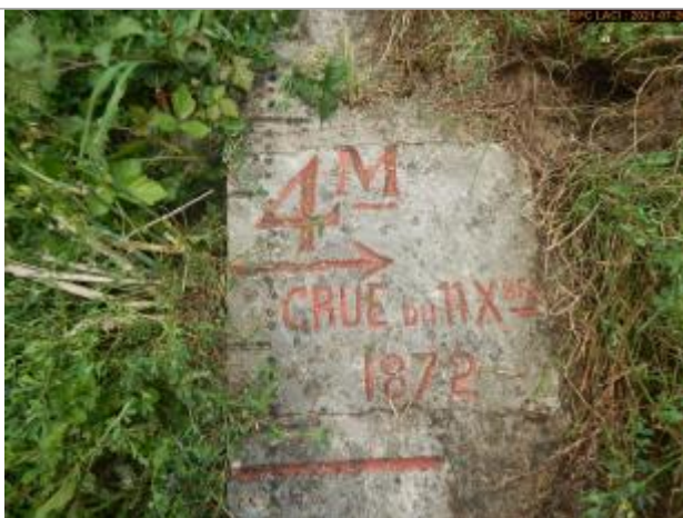
Vue du repère rapprochée en 2021 escalier côté pont

Altitude calculée de l'eau (en m) : 102.86 m