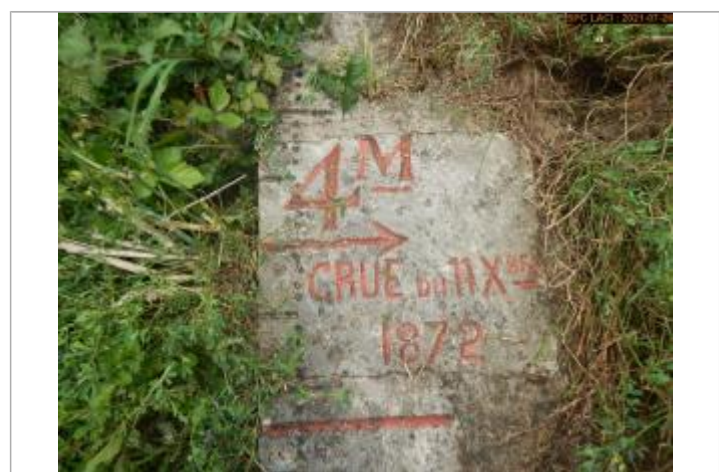
Vue du repère rapprochée en 2021 escalier côté pont

GÉNÉRAL Code : LCI_R_619_1221 Date de mise à jour : 11/02/2022 Auteur : SPC LCI