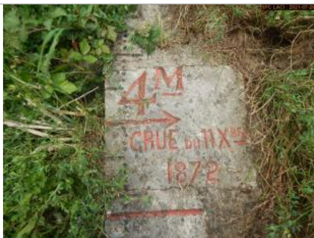
Vue du repère rapprochée en 2021 escalier côté pont

Altitude calculée de l'eau (en m) : 102.86 m