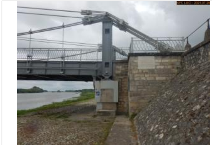
Vue du site en 2021