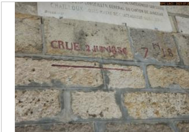
Vue du repère rapprochée en 2021

Altitude calculée de l'eau (en m) : 109.9 m