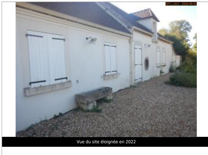
Vue du site éloignée en 2022