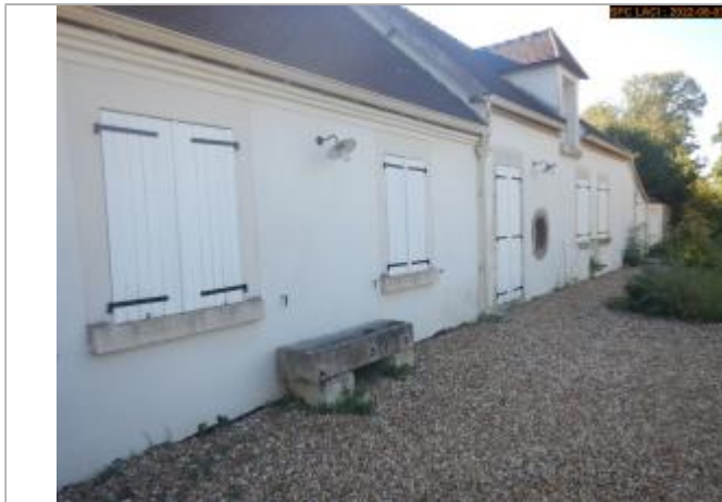
Vue du site éloignée en 2022