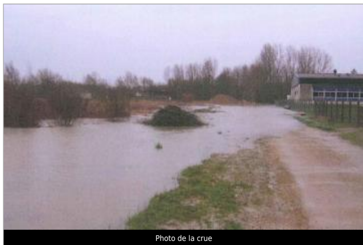
Photo de la crue