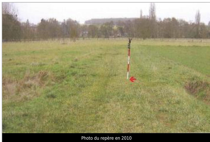
Photo du repère en 2010