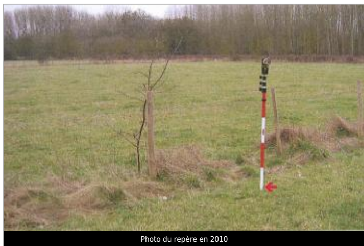
Photo du repère en 2010